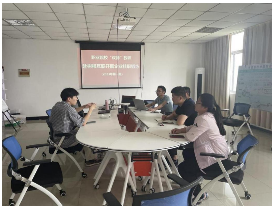
图4-3 2023年暑期教师去树根互联参加企业实践

为贯彻落实《教育部财政部关于实施职业院校教师素质提高计划（2021-2025年）的通知》（教师函〔2021〕6号），提升教师数字化素养与能力，为“数字产业化”与“产业数字化”培养高素质技术技能人才。湖南信息职业技术学院与树根互联股份有限公司聚焦专业数字化升级改造，2023年7月利用暑期时间积极开展教师职业技能提升培训。培训班聚焦企业智能化转型升级需求，是我们紧跟新时代职教发展的步伐，提升专业建设水平和教师数字化教学能力的需要。