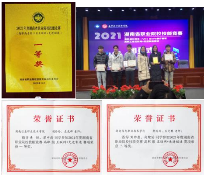
图2-6 湖南职业院校技能竞赛工业互联网+先进制造一等奖、三等奖