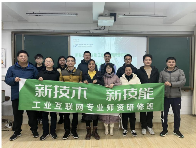
图4-5 新技术新技能工业互联网专业师资培训