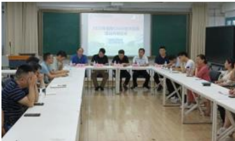
图4-4 2023年专业数字化升级开班会