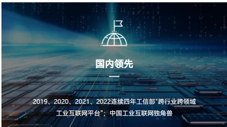
图1-2 树根互联连续多年入选中国工业互联网独角兽企业