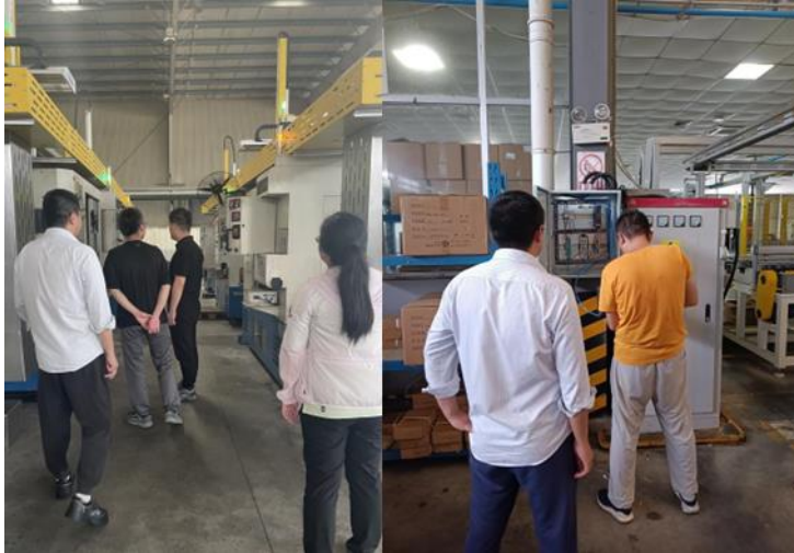
图5-2 教师深入企业参与相关产品的生产、工艺流程