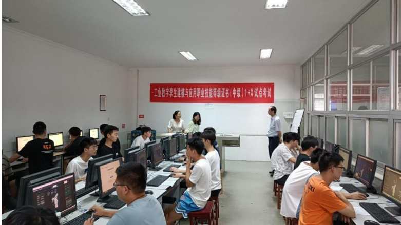
图4-8 工业数字孪生建模与应用职业技能等级证书考试现场