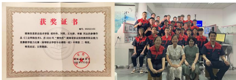
图2-7 教师获教学成果奖