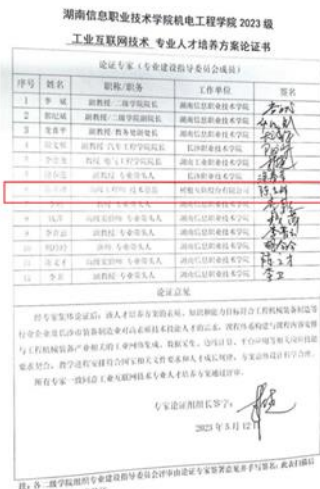
图2-2 树根互联参与工业互联网技术人才培养方案制定