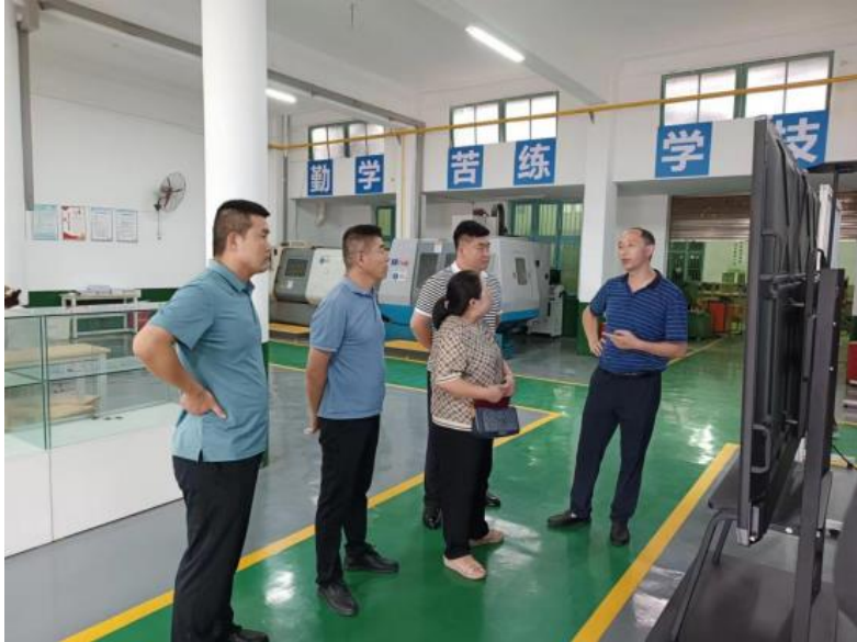
图5-1 树根互联调研湖南信息职业技术学院