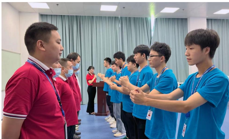
图4-7 现场工程师拜师礼

聚焦行业需求，推进岗课赛证融通，为积极稳妥推进“1+X”证书制度试点工作，2023年6月17日，我院机电工程学院联合长沙树根互联技术有限公司组织“工业数字孪生建模与应用职业技能等级证书（中级）”考试，30名学生参加“理论+实操”的考核，最终28名学生通过测试，通过率93.3%。