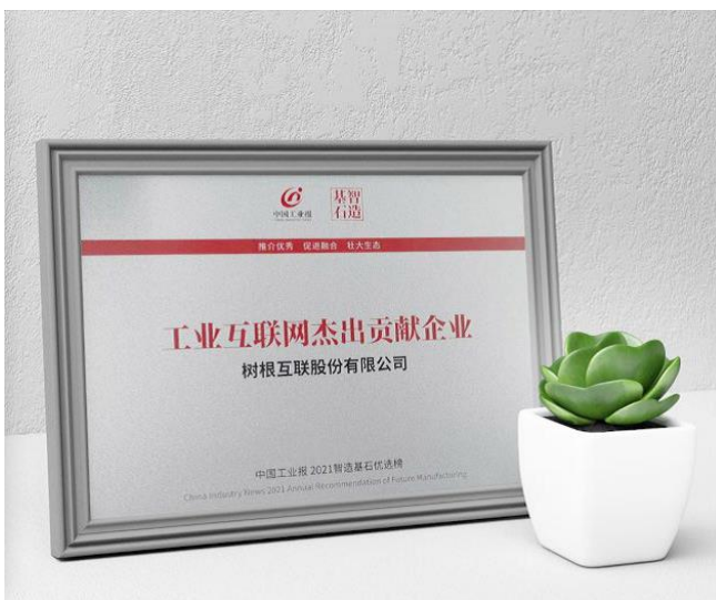
图1-1 工业互联网杰出贡献企业

积极作用。根云平台在2019-2022连续四年入选Gartner“全球工业互联网平台魔力象限”并位居中国第一；2022年，树根互联成功上榜《IDC MarketScape：中国数字工厂整体解决方案厂商评估》并位居领导者象限；另外，在IDC发布的《2021年中国工业互联网平台市场厂商评估》结果中，公司位于领导者象限，技术力位居中国第一；在福布斯中国《2021年度中国十大工业互联网企业》排名中，公司位列第一；公司于2021年取得CMMI最高等级5级认证。