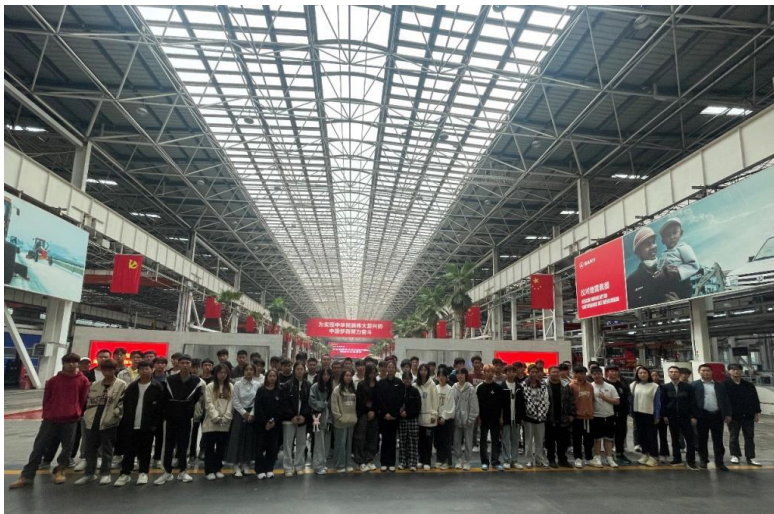
图2-1 “现场工程师”班学生企业学习

为了促进校企共同发展，湖南信息职业技术学院与树根互联股份有限公司双方本着“资源共享，优势互补，责任同担，利益共享”的原则开展校企合作，于2022年5月签订校企合作协议，加快打造具有高水平的现代化高等职业教育体系，共建国内有影响力的产教融合创新共享平台，培养更多具有良好专业知识、实际操作技能和职业态度的高素质、高技能的应用型人才。双方就工业互联网技术专业探索现场工程师的办学模式，目前已成立了1期“现场工程师”人才培养班，实现了教育资源和生产资源的整合。企业技术人员不仅以导师的身份对学生进行现场教学，并且参与到学生的理论教学当中，实现学生教育环节企业全覆盖。