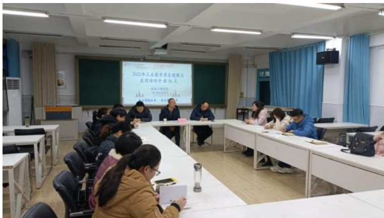
图4-6 工业数字孪生建模与应用教师技能培训