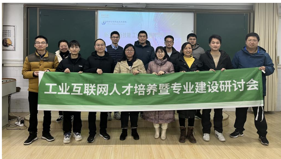
图4-1 工业互联网专业建设研讨会

是以建设国家级课程为抓手，提升课程教学资源建设水平。校企联合整合优化专业群课程体系，实现课程体系与产业体系梯度衔接，通过建设高质量的国家级线上、线下课程来提升课程教学资源水平。三是以企业进课堂为切入点，推进教材与教法改革。改革课堂教学方式，探索企业进课堂，打造模块化校企联合课堂教学团队，发挥企业和学校的特长和优势，潜心培养兼具理论与技能的复合型财经工匠人才队伍。四是以内功修炼为核心，打造教师教学创新团队。鼓励教师“走出去”开展企业实践，提升实践技能水平；将行业内优秀的职业人才“请进来”，打造一支专兼结合的高水平双师队伍。