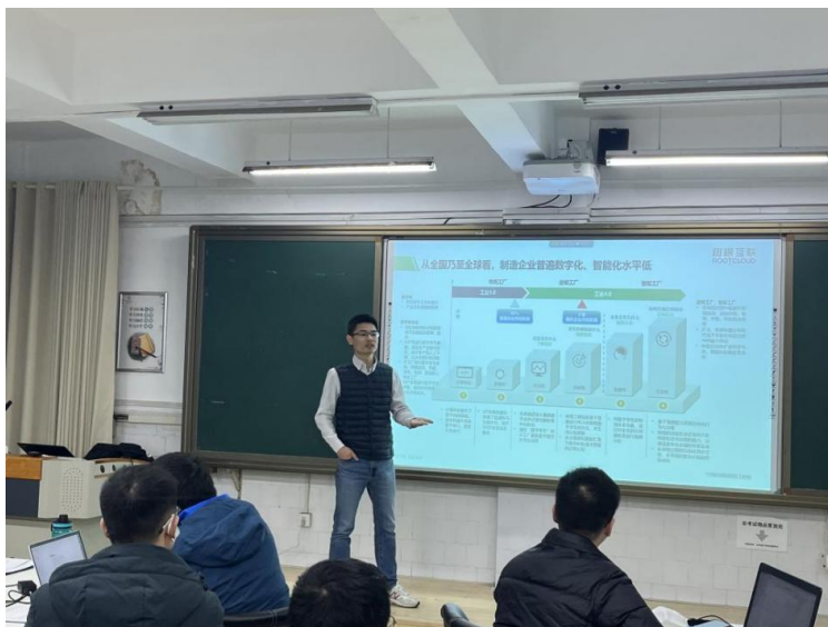
图2-3 产业导师上课现场